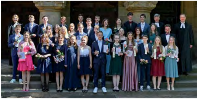
Konfirmation am 28. Mai 2023, 9.00 Uhr