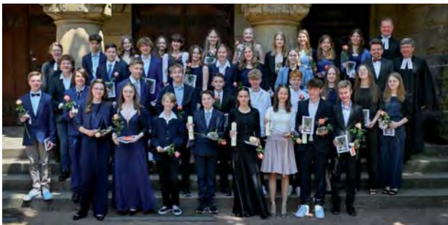
Konfirmation am 28. Mai 2022, 11.00 Uhr