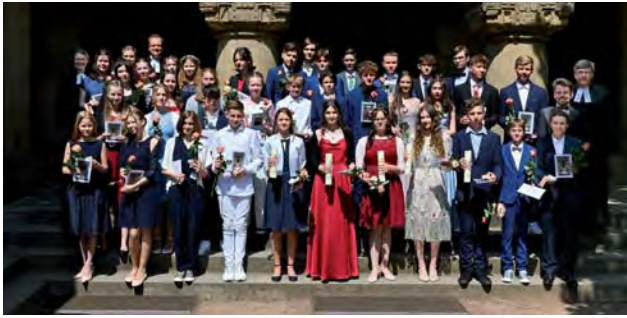
Konfirmation am 27. Mai 2023, 13.00 Uhr