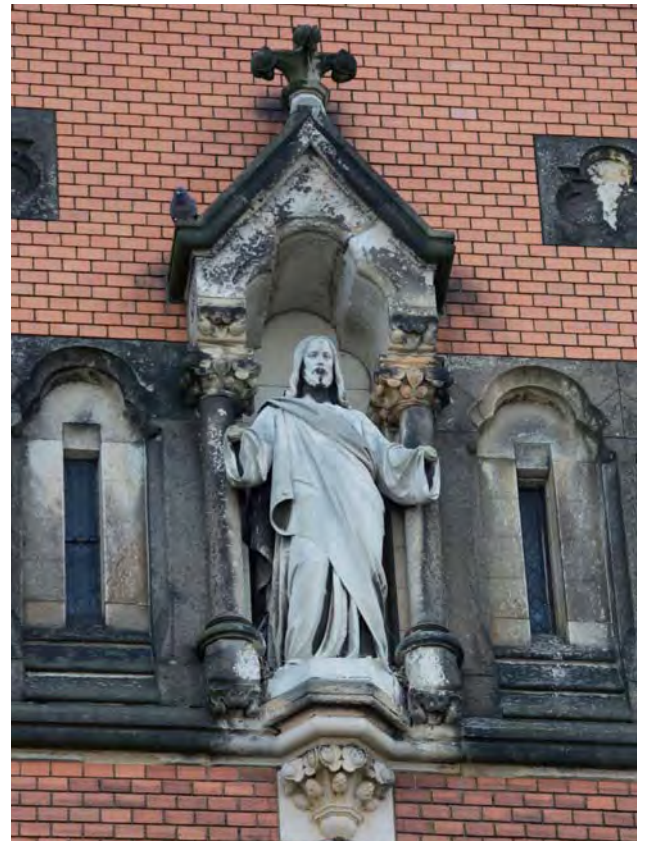
Jesusfigur an der Heilig-Geist-Kirche

dienstags 9.30-11.30 Uhr, SIZI Versöhnungskirche