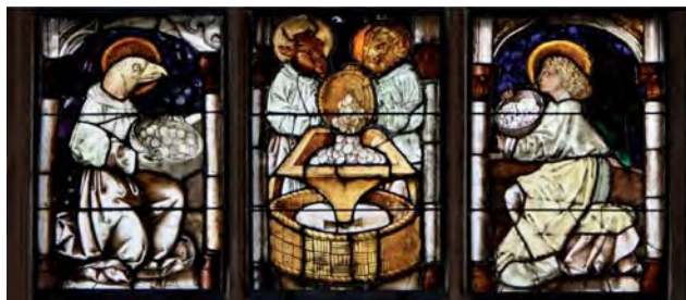
Hostienmühle. Glasfenster in der Kirche St. Lorenz in Nürnberg, 1481.

Zugegeben - es war diesmal nicht leicht, die richtige Lösung des Sommerrätsels zu finden, das in der letzten Ausgabe der Kirchennachrichten (Juni/ Juli) abgedruckt war. Wer den Kirchentag in Nürnberg besucht hat, hatte dort die Gelegenheit, das mittelalterliche Glasfenster in der Kirche St. Lorenz zu betrachten, das im Jahr 1481 für diese Kirche gestaltet wurde. Hier ist kein Opferstock dargestellt, wie man zunächst meinen möchte. (Es war nicht die Aufgabe der Evangelisten, Geld oder Kollekte zu sammeln!). Die Evangelisten haben in ihren Körben nicht Geld oder Lebkuchen, sondern Hostien, die sie in eine Hostienmühle schütten. Der Glasmaler hat nicht vergessen, in jede Hostie ein Kreuz zu malen.