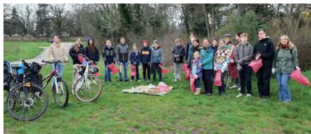
Elbwiesenreinigung im April 2023 mit Konfirmanden unserer Gemeinde