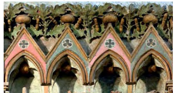
Fries mit Stieleiche am Westlettner des Naumburger Domes

Eingeladen wird zu einem Vortrag mit Frank Richter über „Gärten aus Stein. Die Pflanzenwelt des Naumburger Meisters“. Vorgestellt wird der reiche Schatz von Bildwerken aus Stein mit Pflanzenmotiven in den Domen von Naumburg und Meissen. Die Pflanzen wurden von den Bildhauern des Mittelalters wirklickeitsgetreu in Stein nachgestaltet. Die „Gärten aus Stein“ sind ein Lobpreis auf Gott, den Schöpfer.