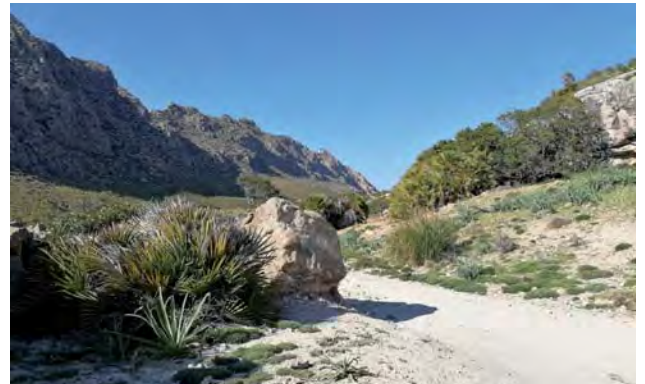
Weg im Vall de Bóquer auf Mallorca

Urlaubszeit ist Reisezeit, Zeit zum unterwegs sein. Da lockt uns nach der Pandemie endlich wieder die große weite Welt und gern nimmt der Eine oder die Andere von uns die Strapazen einer langen Reise auf sich, um ans lang ersehnte Ziel zu kommen. Nach meinem Geschmack genügt auch das Reisen zu Fuß bei einer Wanderung in unserer wunderbaren Umgebung oder einem ausgedehnten Sommerspaziergang. Ein Genuss, den Weg in Ruhe zu gehen, dessen Schönheiten zu genießen und neue Entdeckungen zu machen. Ich glaube, niemandem würde es einfallen, einfach stehen zu bleiben, nicht weitergehen zu wollen und das Ziel so nicht zu erreichen, mag der Weg - bei aller Schönheit und Entdeckerfreude - auch noch so anstrengend sein. Aber wie sieht das Ganze in meinem und in Ihrem Leben aus, wenn wir den Lebensweg einmal als Parallele zu unserer (Sommer-) Reise zeichnen würden? Sehen wir unsere Reise nicht allzu oft als Belastung an, verbunden mit Unzufriedenheit und Schimpfen über die allgemeinen Zustände? Wollen wir nicht doch am liebsten manchmal stehenbleiben und einfach unsere Ruhe haben?