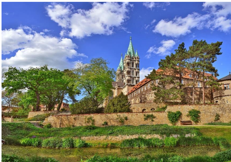
Domgarten des Naumburger Domes